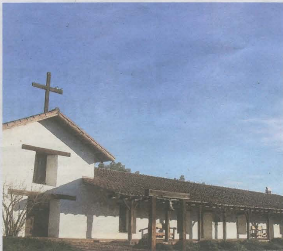
San Francisco Solano, la misión más septentrional

tas instalaciones religiosas y civiles la ofreció la película La Misión , en la que los jesuitas se aliaron con los indios guaraníes para combatir a los portugueses. Pero las misiones franciscanas tienen otra fisonomía. Construidas con adobe encalado, el edificio principal es siempre una iglesia de tejado a dos aguas y alta fachada de la cual salen unos pabellones anejos de una