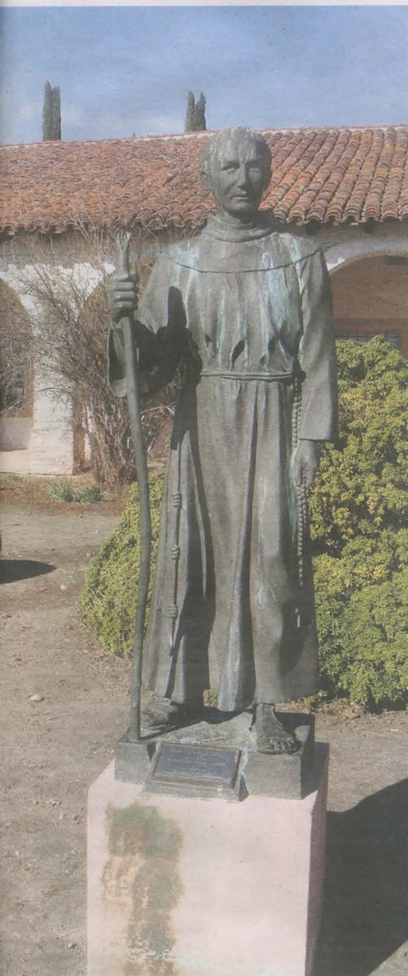
Misión de San Antonio de Padua, junto a la que Hearst elevó su castillo

misiones, repartidas a lo largo de 996 kilómetros de lo que se conoce como el Camino Real. Una de otra dista unas 30 millas, o lo que es lo mismo, un día de caballo. Visitarlas supone una fenomenal experiencia pues la senda discurre por grandiosos paisajes de áridos desiertos, blancas playas y los valles más fértiles.