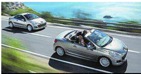
El 207 CC es pionero de los modelos Coupé-Cabriolet.

Ochenta años después del lanzamiento del primer Coupé-Cabriolet, Peugeot se consolida como una de las marcas pioneras en este tipo de coches. Con modelos como el 207 CC y el 308 CC, destaca en el segmento de vehículos