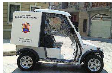
El coche eléctrico que dará servicio en La Pobla.