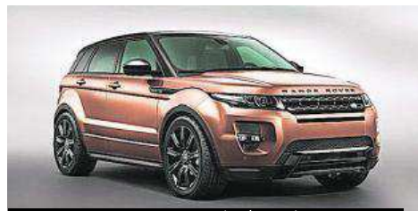
Mejores prestaciones y tecnología en el Range Rover.

Nuevas tecnologías de seguridad, mayor agilidad con el sistema exclusivo Active Driveline, cuatro modelos de llantas de aleación de nuevo diseño y nueva transmisión automática ZF de respuesta dinámica de nueve velocidades