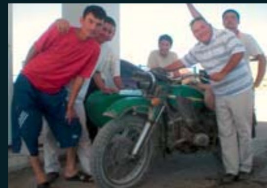
En Kazajstán, un grupo de curiosos posa con su moto Ural.