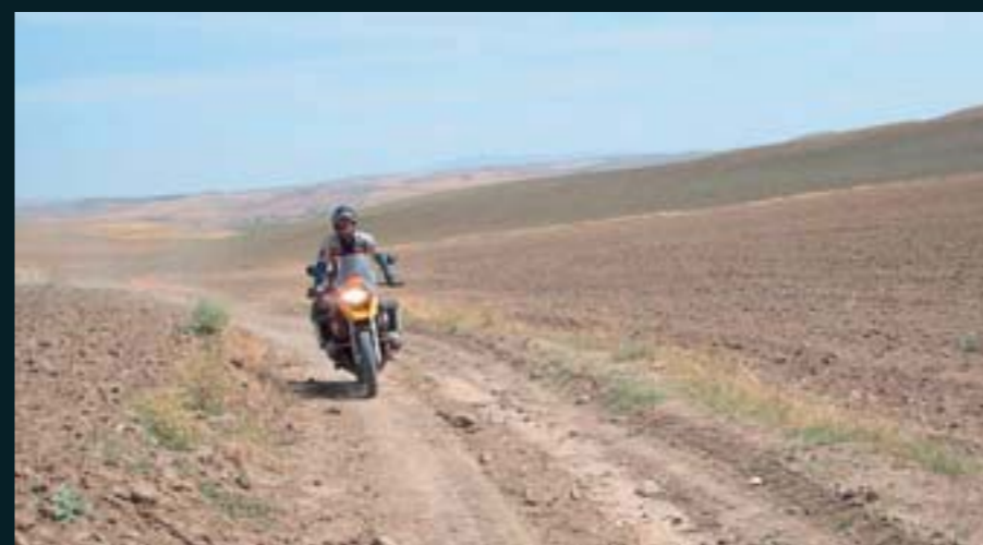
Terrenos áridos y casi esteparios en Turquía.