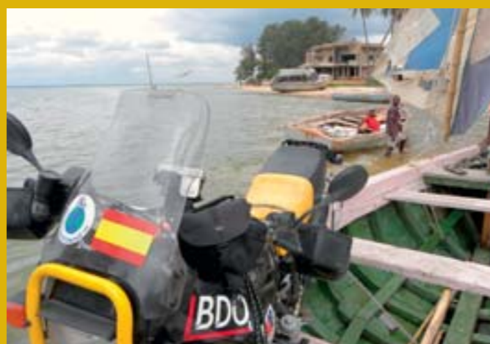
Cruzando la bahía de Inhambane, en Mozambique.