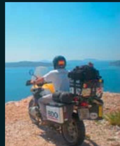
En Grecia, el Peloponeso es de obligada visita.