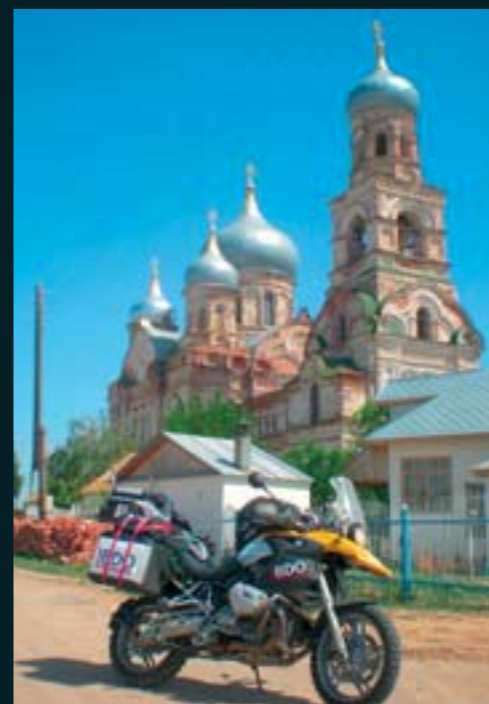
Rusia y sus curiosas iglesias ortodoxas.