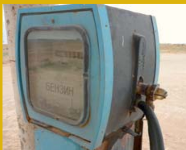
Los surtidores de gasolina son un tanto arcaicos...