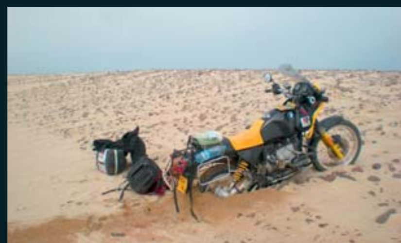
Pequeño problema en la Costa de los Esqueletos, en Namibia.

Una aventura así no es barata... “Teniendo en cuenta que hay que hacer revisiones, comprar neumáticos, pagar visados y afrontar imprevistos, son unos 80 ó 100 dólares diarios. Por supuesto, hay modos más caros de viajar en moto. En Kazajstán encontré quince ingleses que daban la vuelta al mundo en cuatro meses. Llevaban cerrada la ruta y todos los hoteles reservados, les seguía un todoterreno de apoyo con piezas y un mecánico. Viajar con niñera les costaba 30.000