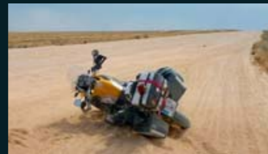
La GS, al suelo, sobre un lecho de arena fina... Mal asunto.