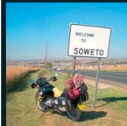
Estamos en Sudáfrica, Soweto.