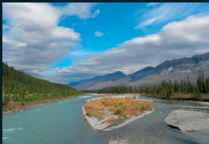
Increíble paisaje de las Montañas Rocosas en Canadá.