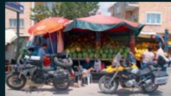
Hora de comer algo de fruta en Turquía.