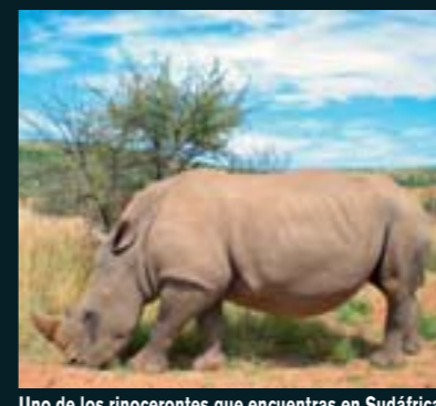
Uno de los rinocerontes que encuentras en Sudáfrica.