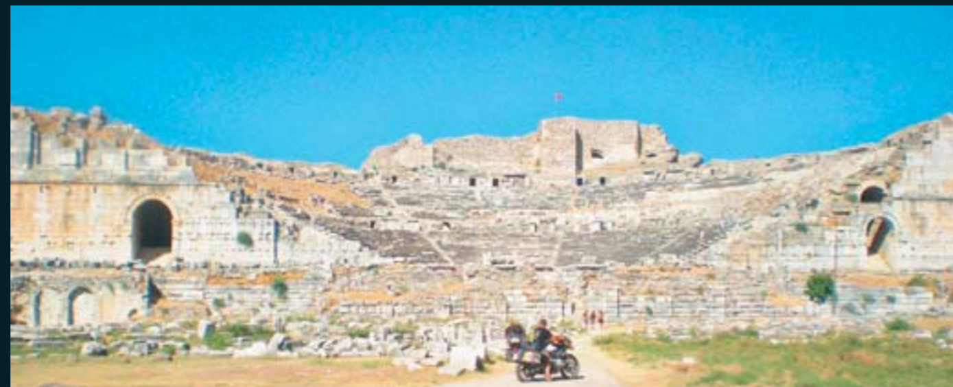
Un alto en las ruinas del teatro romano en la ciudad de Mileto, Turquía.