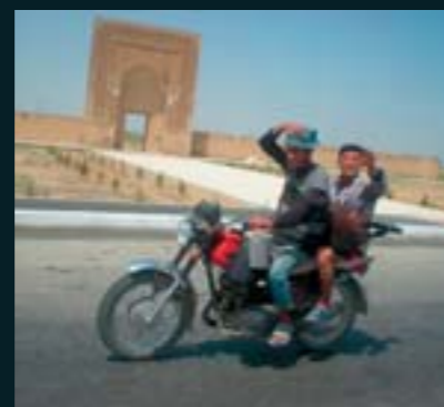
Moteros de Uzbekistán; sin casco, claro.