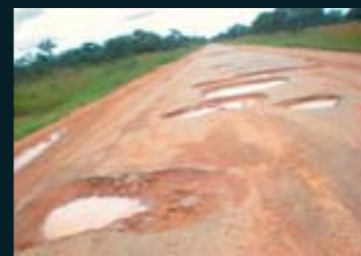
En Tanzania las carreteras son así...