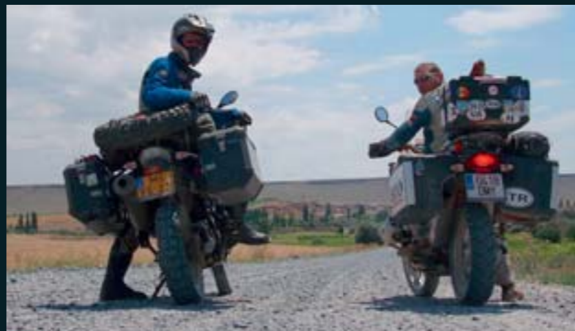
En Turquía, en compañía de un holandés errante.