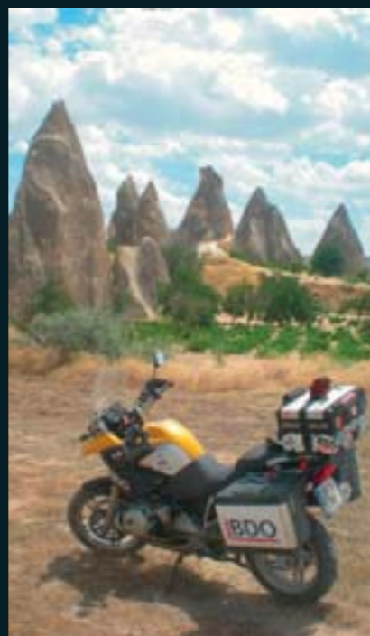
Bella estampa de la región de Capadocia, en Turquía.